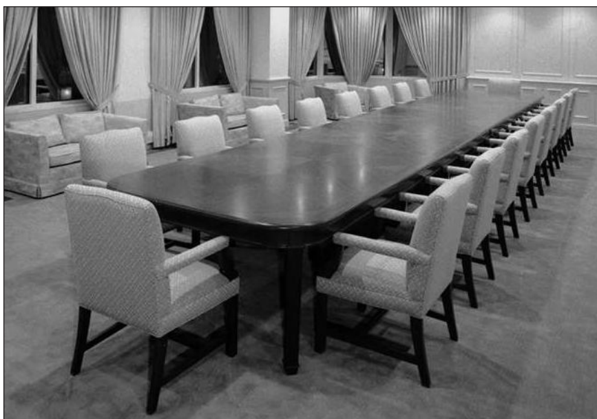
Chi si siederà al tavolo che guida l'Ordine dei Medici provinciale?

Medico e del Cittadino dinanzi a sperimentazioni gestionali nella sanità pubblica;