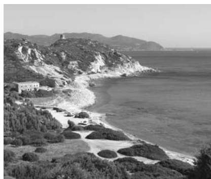
Una panoramica di Villasimius

Il Congresso nazionale della Fimmg si terrà nella prima settimana di ottobre 2006 presso il Tanka Village di Villasimius. Nella prima parte della settimana ci sarà la parte scientifica (con relativa quota di crediti Ecm) mentre da mercoledì 4 a domenica 8 si svolgerà la parte prettamente sindacale.