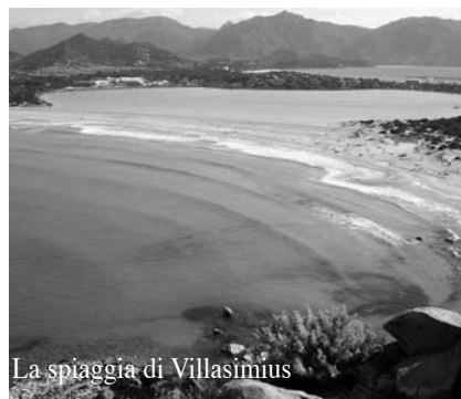
La spiaggia di Villasimius

Chi ha intenzione di partecipare può comunicare la sua disponibilità alla Segreteria provinciale ed otterrà le relative istruzioni.